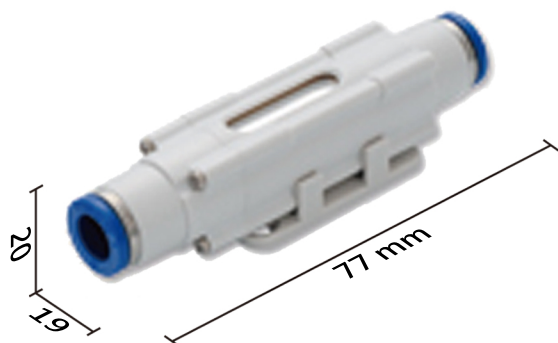
Model : MFU50-44